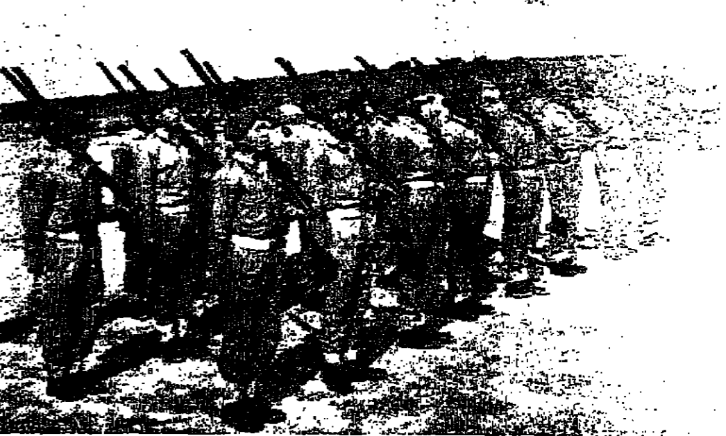
عازرون الجنين يحمل السلاح وهو يتلقى التدريب العسكري في المستنقعات الخاصة التي اقيمت للجنين بالخدمة الوطنية